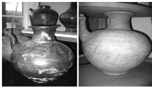
Fu Nam Vase - Mekong Delta, Oc Eo Culture (Private Collection)

Các di tích khảo cổ cũng cho thấy người Phù Nam trồng sản phẩm nông nghiệp như lúa. Nhà cửa được kiến trúc theo kiểu nhà sàn, có tầng gác bằng gỗ chôn xuống bao bọc xung quanh thành. Cho đến nay vẫn chưa có dấu tích đồ gốm như đồ gốm Thạp đồ gốm Phù Nam như vậy. Có nhóm nghiên cứu cho rằng nó nằm gần thạp đồ gốm Angkor, có nghĩa là người Phù Nam có liên hệ với người Khmer, người Campuchia, có lẽ thuộc vùng sông Mê Kông hiện tại, tức là liên hệ đến Việt Nam. Các cuộc khảo cổ cũng chứng minh được là người Phù Nam đã biết sản phẩm trong giao dịch hàng và trồng là một trung tâm thương mại, giao dịch sản phẩm với Trung Hoa, Miến Điện và Ấn Độ.