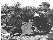
Đội Bành Địch Hoài (trái) tập hợp tại Trường Sa

6-. Từ tháng 12-1930, Tổng cộng tập trung quân tiến hành càn quét lên các khu đồi. Chỉ huy của Mao là đi sâu quân Tổng cộng vào vùng căn cứ hiểm trở và phức tạp. Mao được sự yểm trợ rất hiệu quả của mạng lưới tình báo đồng đội của các quân quân báo GRU của Liên xô, gồm hơn một trăm tình báo viên chất lượng khá do Liên xô tuyển dụng cao, nắm sâu trong các sự chỉ huy tối cao, bắt tổng tham mưu, các quân chủng, quân đoàn, sư đoàn của Tổng cộng. Họ có phương tiện truy cập tin tức nội địa. Các cuộc càn quét lên đồi được báo trước, có khi chính xác cả thời điểm ngày giờ và lực lượng, đưa đội mìn tổng tiến quân. Tiêu biểu là Richard Sorge hoạt động ở Thượng Hải, đã thâm nhập sâu vào hàng ngũ các chuyên gia quân sự Đức trước Hitler cũng sang giúp Tổng cộng. Chính Sorge sau này đã báo cáo với Staline rằng chiến tranh thế giới sẽ nổ ra ở châu Âu trước, Nhật không có ý định tiến công Liên xô vào thời điểm này.