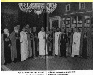
CÁC HỒI ĐỒNG GIÁO HỘI VIỆT NAM TẠI HỘI ĐỒNG GIÁO HỘI CHINA 1960 VIỆT NAM NGÀY 18-11-1960

( Thông điệp Thủ Lãnh các Chúa - Chiên )