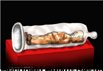
Trò chơi r m