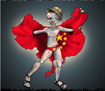
Trò chơi r m