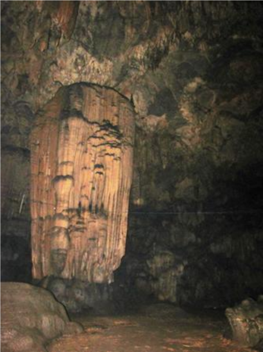
Bu ng t m cô tiên