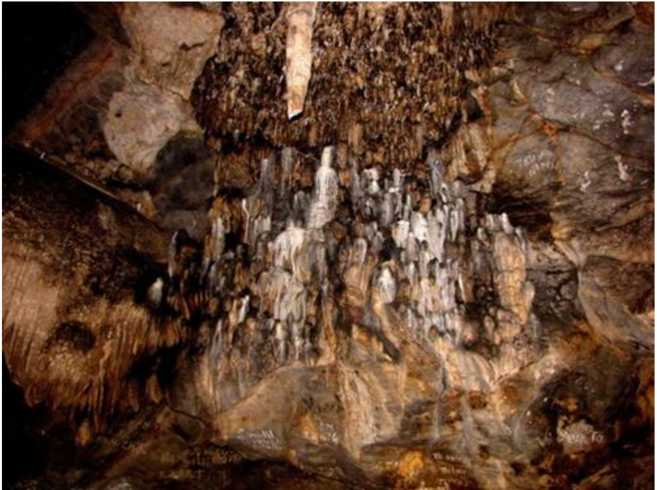
Bàn thờ tiên và nhũ đá nhũ lên t o ra nhũ u nhân hình k thú

M t vòng quanh đ ng, gi a c nh v t h o đ p nh đ c v , trong tôi c v ng v n m i m t câu h i: li u chàng Thơ c có tr v đ c c i tiên đ g p n àng H ng khi đ ng này đ ng th t là c i tiên.