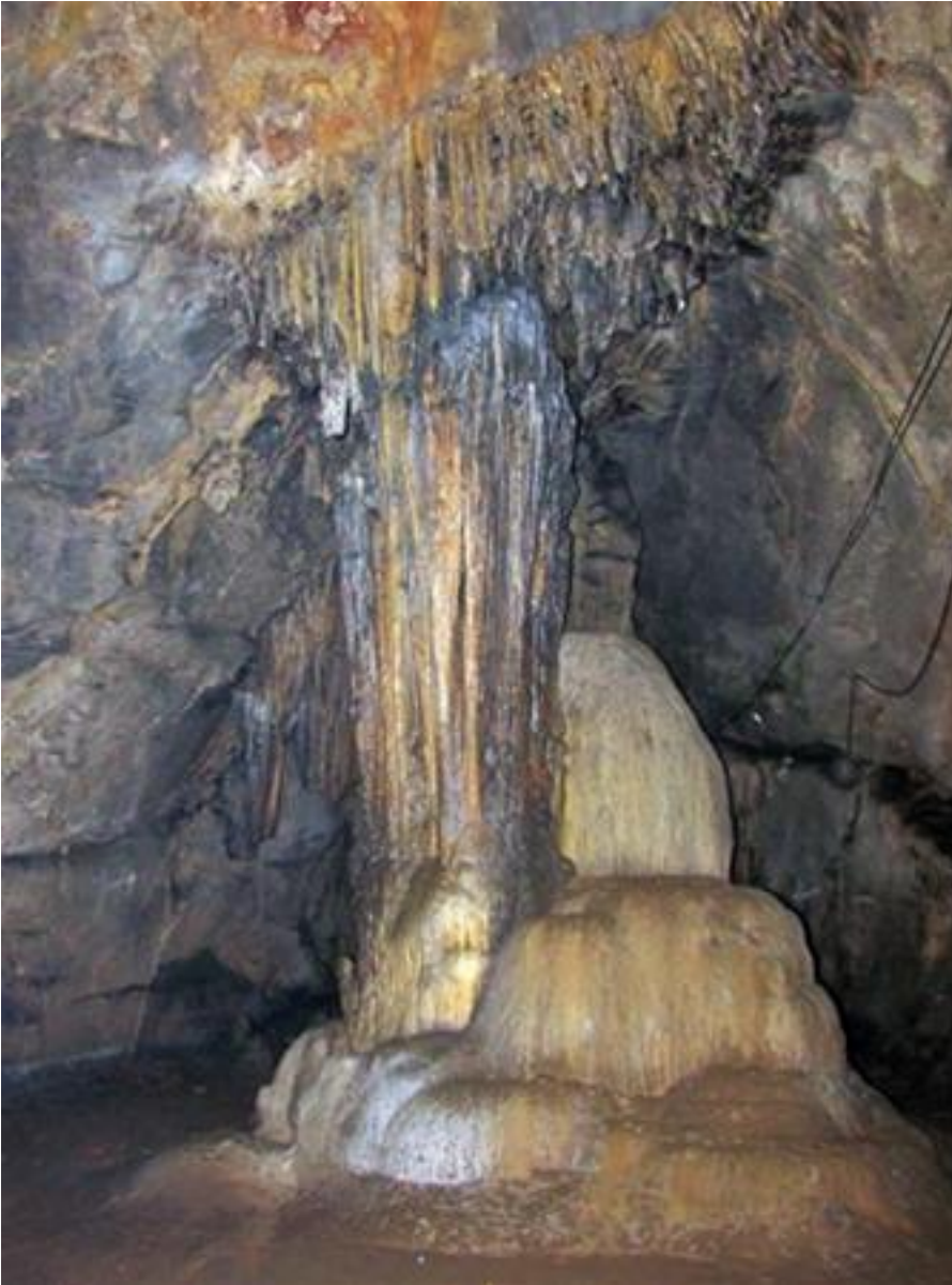
Kho g o h p d n h n b i nh ng h n đá m n đ c g n ch t, đ u màu nâu b c