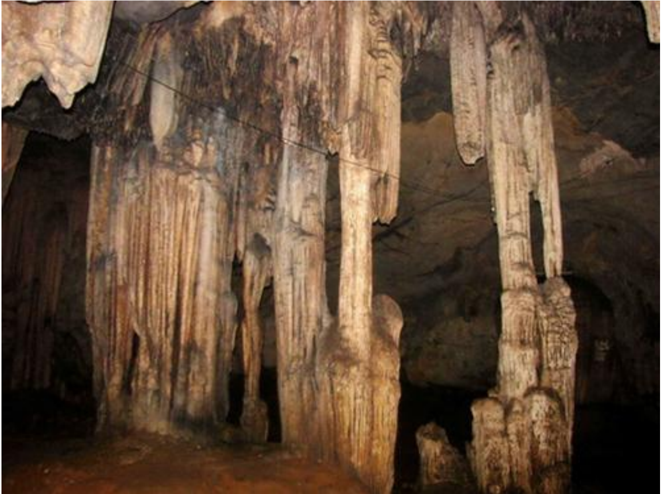
Đĩ ng Tĩ Thĩ c

Đĩ ng chính gĩ m hai phĩ n, phĩ n ngoài rĩ ng, trĩ n đĩ ng hình vòng cung nhĩ chiĩ c bát úp khĩ ng lĩ . Phía đĩ i vòng cung có mĩ t nhĩ đá "tĩ a" xuĩ ng trông nhĩ trái đào tiên nên đĩ ng còn đĩ c gĩ i là Bích Đào. Dĩ i là nĩ n đá phĩ ng, nhĩ n, là vĩ t tích đĩ n thĩ Tĩ Thĩ c còn lĩ u lĩ i đĩ n hôm nay. Sau đó là đĩ n nhĩ thĩ ch lĩ p lánh đĩ c ví nhĩ nhĩ ng kho chĩ a vàng bĩ c, gĩ o muĩ i... đĩ c dân gian lĩ u truyĩ n.