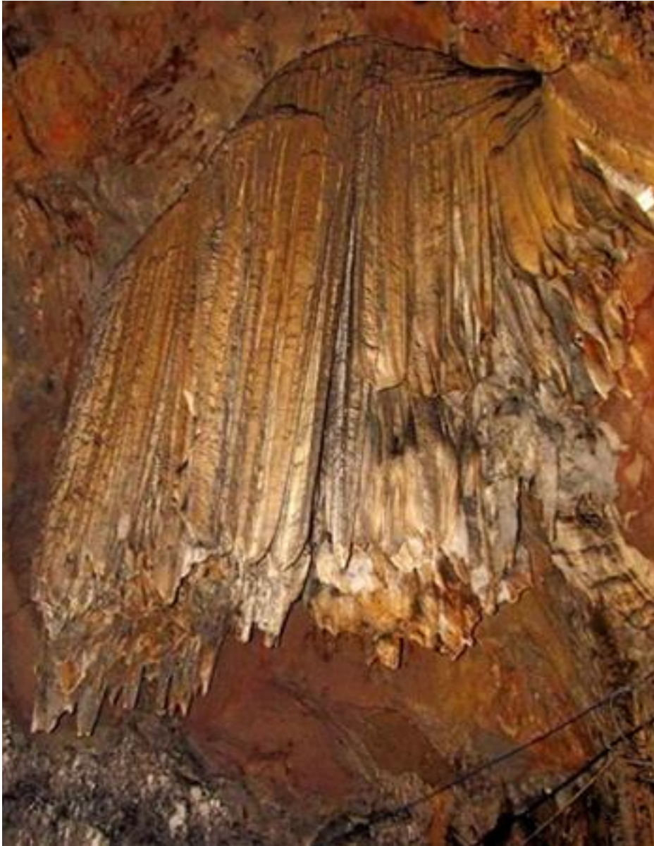
Nḥng nhũ đá rũ xụng ṭ trên nóc đ̣ng phát ra âm thanh đ̣c đáo