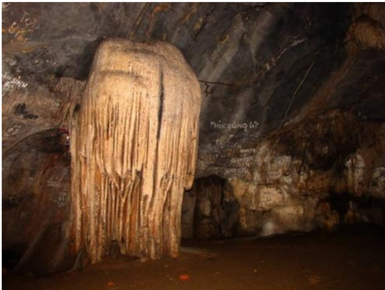
Kho mu i là m t qu n th th ch nhũ bé, tr ng toát