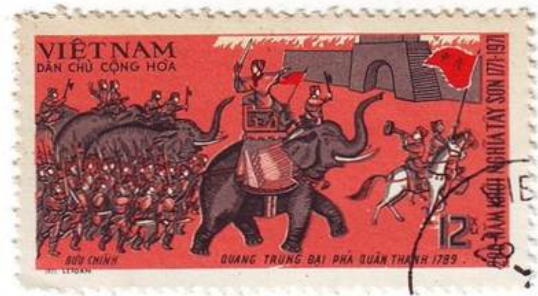
Nguyễn Huệ ở Nhà Dân chủ Cộng hòa